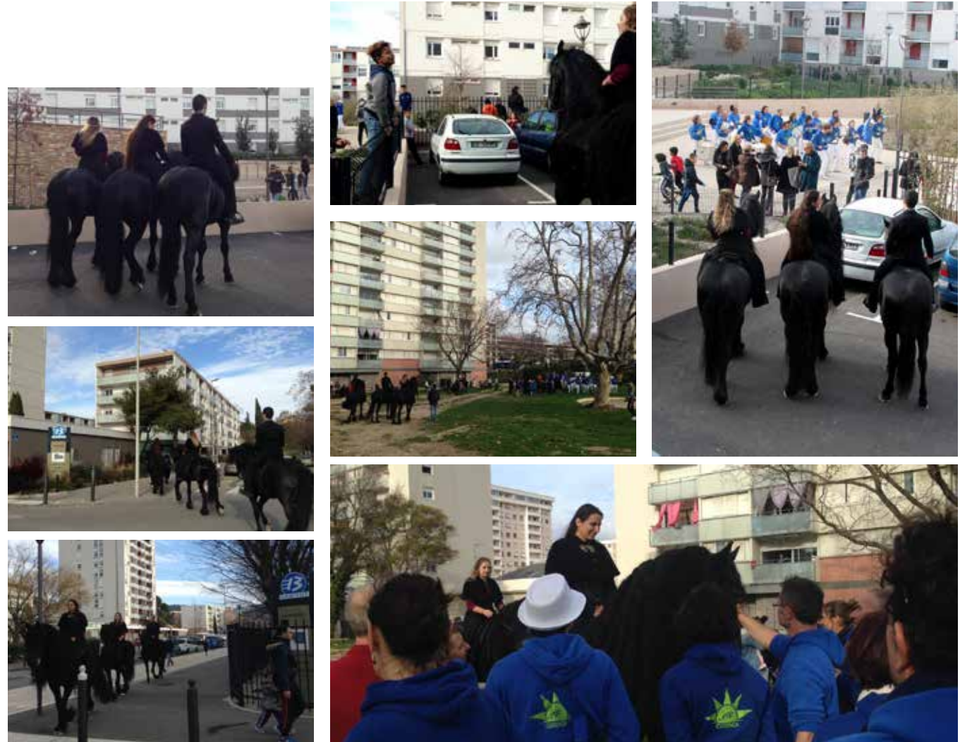
© Raymond Cresp - Alargo Mazargues | © Gabriella Rault - Théâtre du Centaure

Samedi 6 janvier 2018 — 250 personnes de tous âges du territoire