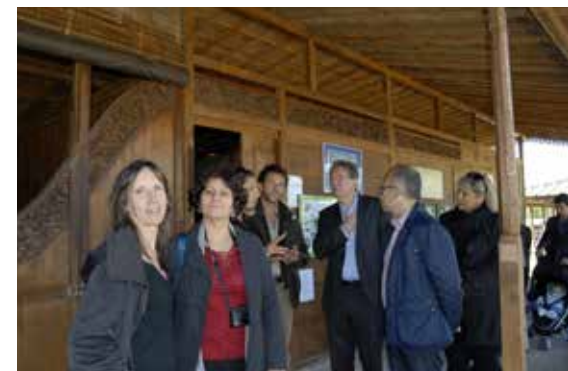
© Raymond Cresp - Alargo Mazargues