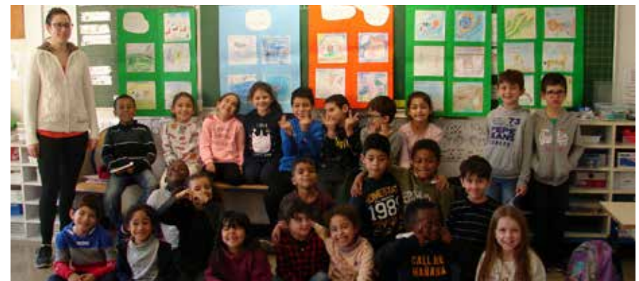
© Raymond Cresp - Alargo Mazargues