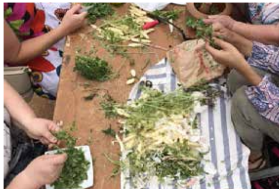
© Raymond Cresp - Alargo Mazargues