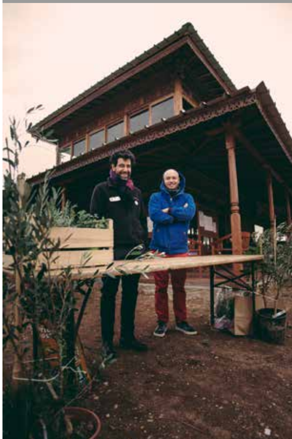
Cristiano &amp; Romain