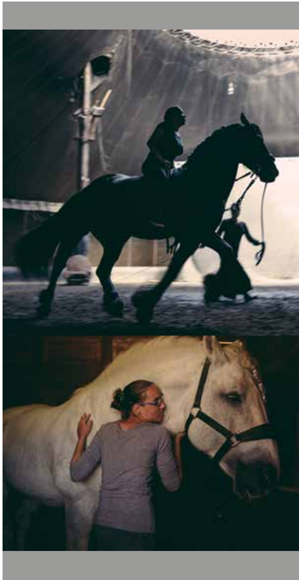
© Francesca Todde - Neutral Grey

A Marseille, Les Baumettes accueillent le théâtre du Centaure — 5'10