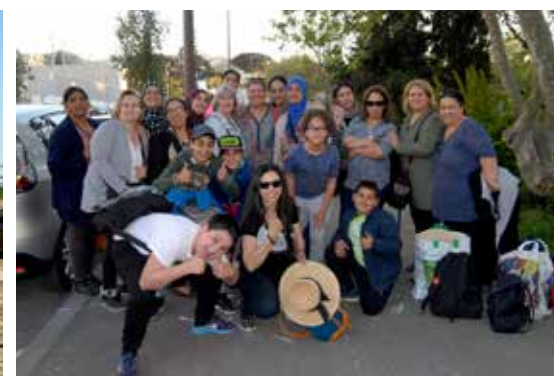
© Raymond Cresp - Alargo Mazargues